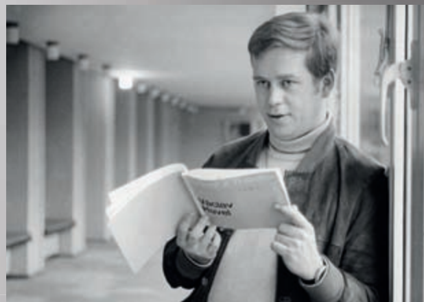
V roce 1968 s programem německého divadla.