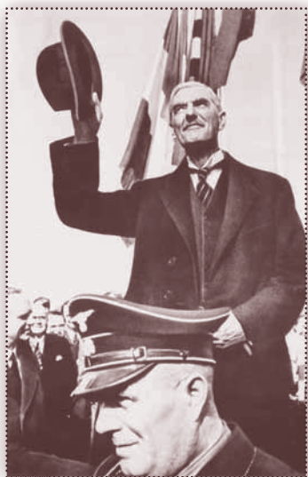
🕒 Hlavní představitel politiky appeasementu britský premiér N. Chamberlain po přeletu do Mnichova.