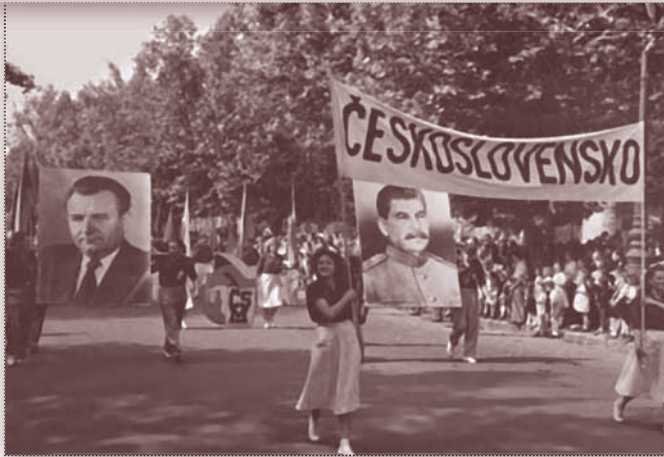
Průvod členů nově založeného Československého svazu mládeže (ČSM) v srpnu 1949.

Převzetí politické moci komunisty a definitivní začlenění Československa do sovětského bloku v únoru 1948 přineslo velmi záhy zcela bezprecedentní společenské a hospodářské změny, které v následujících letech pocítil prakticky každý občan.