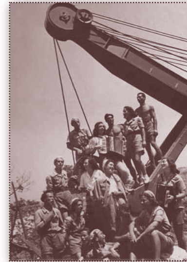
Nejen členové ČSM odjížděli v letních měsících na pracovní brigády „budovat socialismus“. Například výstavby 21 km dlouhé „trati mládeže“ (železnice) z Horné Dúbravy do Banské Štiavnice se v roce 1949 účastnilo 40 000 brigádníků.

K dosažení vytyčených cílů bylo potřeba společnost nejprve mocensky zcela ovládnout . Dosavadní občanská pluralitní společnost , založená na existenci nezávislých zájmových organizací, svobodě slova a nezávislé kultuře, zanikla už krátce po únoru 1948. Sokol , Orel , Junák , skautské hnutí, nezávislé studentské spolky byly rozpuštěny. Namísto nich byla veškerá dospívající mládež podchycena v komunistickém Československém svazu mládeže s fakticky povinným členstvím. Obdobně bylo naloženo i se všemi ostatními společenskými organizacemi.