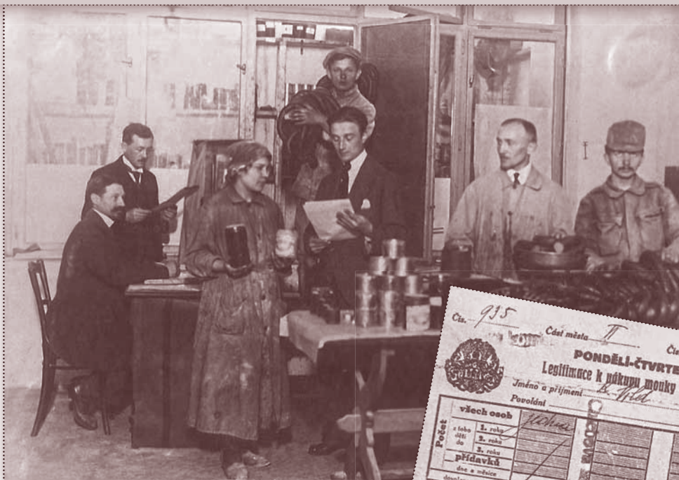
☞ Na jaře roku 1915 byl v českých zemích zaveden tzv. přidělový systém.

Dějiny českých zemí a celého Rakousko-Uherska za první světové války se dělí na dvě základní etapy, časově vymezené panováním císaře Františka Josefa I. (1914–1916) a jeho následníka Karla I. (1917–1918). Obě období se od sebe dosti výrazně lišila.