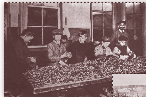
☞ Pražská továrna na náboje do ručních zbraní. Zmobilizované muže musely ve válečné výrobě zastoupit ženy a také děti.