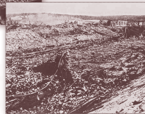
☞ Areál muniční továrny v Bolevci u Plzně zcela zničený po mohutném výbuchu 25. května 1917. Neštěstí, při kterém zahynulo více než dvě stě lidí, později inspirovalo českého spisovatele K. Čapka k napsání románu Krakatit .

Většina obyvatel českých zemí se s válkou rakouského mocnářství proti slovanskému Srbsku a Rusku neztotožňovala už od jejího samotného počátku. Zvláště za situace, kdy císařství stálo v pozici zjevného agresora, který započal válečné operace. Vyhlášení války a mobilizace proto mezi Čechy nezbudily prakticky žádné nadšení – na rozdíl od euforie vládnoucí v jiných zemích (zejména v Německu, Velké Británii či Francii). V Čechách a na Moravě se mnozí snažili vojenské službě spíše vyhnout, další doufali v brzký konec války a vítězství Ruska či pomýšleli na dezerci. Zrodilo se všeobecné přesvědčení o „cizí válce“. Společnost se s habsburským mocnářstvím již ve druhé polovině roku 1914 definitivně rozešla.